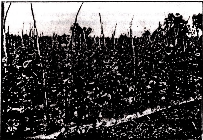
Gambar 3. Buah melon yang telah menunjukkan tanda masak segera dipanen

Buah melon yang sudah dipanen tidak boleh ditumpuk, sebab akan merusak kualitas buah. Tempat penyimpanan tidak boleh terlalu lembab, diusahakan tempatnya kering, sejuk dan sirkulasi udara berjalan lancar.