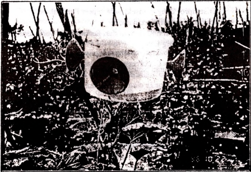
Gambar 4. Perangkap Taalat buah dengan menggunakan sex pheromon.