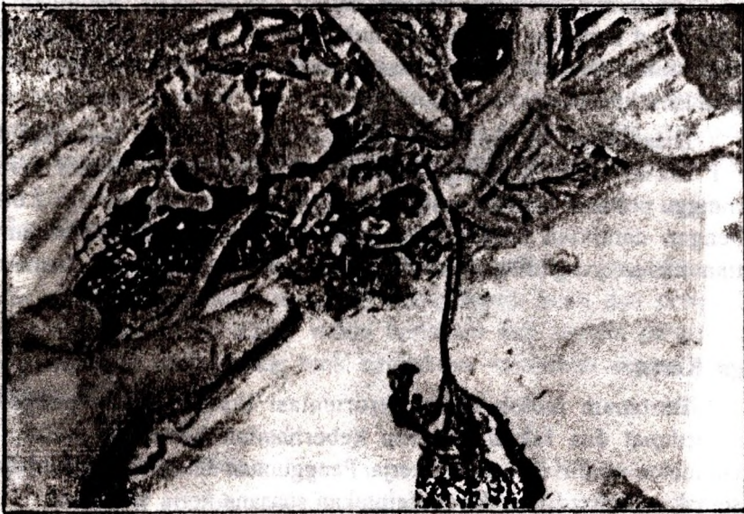
Gambar 5. Serangan bercak belang dapat mengakibatkan kematian tanaman.